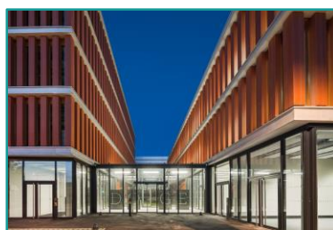
Le Doge, Lille Euratechnologies par Nacarat/Rabot Dutilleul Construction