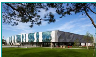
Restaurant Well Being Airbus – Technal Découvrir la référence chantier

La durabilité du bâtiment doit être pensée de façon globale, en réduisant son impact environnemental avant, pendant et après son utilisation . Nous agissons sur l'ensemble du cycle de vie de nos produits , de la sélection de nos billettes d'aluminium jusqu'à leur recyclage. Ainsi, plus de 50 % de la production totale de Technal est basée sur l'aluminium recyclé et nos gammes de produits ont été développées et conçues pour répondre aux normes de construction écologiques et durables tels que BBC, BREEAM, LEED, ou encore le label PassivHaus.