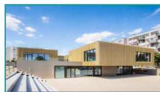
Espace culturel et centre social, Nemours – Technal Découvrir la référence chantier