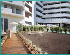
Écoquartier Smartseille – Eiffage Immobilier Méditerranée

Pour leur part, APRR et AREA encouragent les éco-mobilités et ont notamment lancé plusieurs lignes de covoiturage qui comptent des arrêts prédéfinis, sur le modèle des lignes de transport en commun, et ce sur six autoroutes - A41, A42, A43, A48, A49 et A51 – tout en développant les bornes de recharge électrique sur leur réseau.