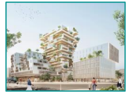
Tour Hyperion Bordeaux ©Jean Paul Viguier et associés