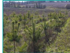
Reboisement au Bois d'Orcan