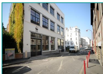
Réhabilitation d'un bâtiment pour le siège social du WWF France, Pré Saint-Gervais, par Rabot Dutilleul Construction

Construire des bâtiments est une activité à impact : consommation d'énergies, émission de gaz à effet de serre, appauvrissement de la biodiversité, développement d'éléments toxiques... Mais, à la différence d'autres secteurs d'activité comme la pêche ou le transport aérien, il existe des solutions pour une majorité des maux . Il nous apparaîtrait donc coupable de ne pas les mettre en œuvre.