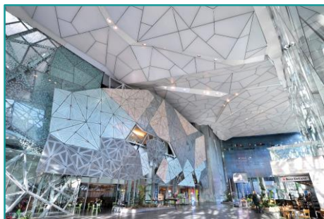
Oslo Opera House Architecte : Snohetta Architects/ Federation Square Australie Architectes : Lab Architecture et Bates Smart

Nous travaillons avec des matériaux recyclables et nous incitons nos partenaires et clients à nous suivre dans cette démarche de réutilisation des matériaux.