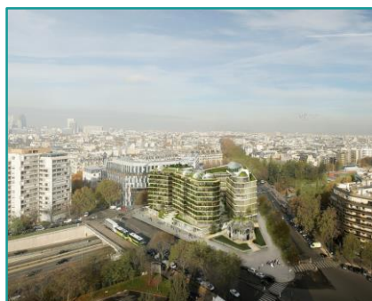
©Jacques Ferrer Architectures / Chartier Dalix Architectes / SLA Paysagistes

Notre ambition est de contribuer au développement de la ville durable en proposant des offres de produits et services qui soient respectueux de l'environnement, efficaces énergétiquement et soucieux de la santé et du bien-être des occupants .