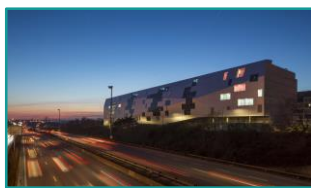
Éco-quartier de Fresnes – Technal Découvrir la référence chantier